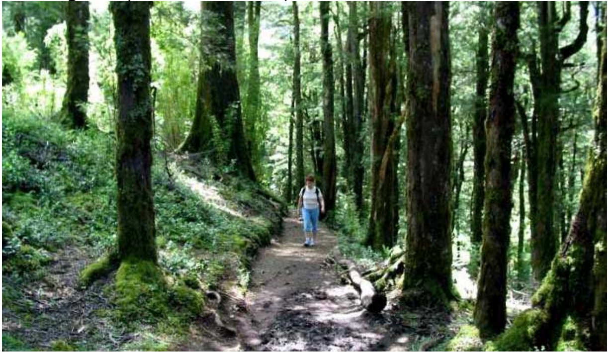
En av vandringslederna i nationalparken Parque Nacional Huerquehue.