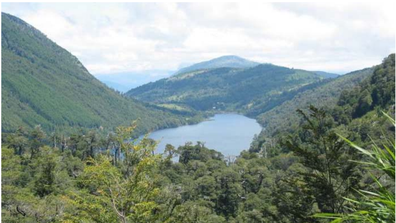
Lago Tinguilco ligger inne i parken. Vi startade i bortre änden av sjön.