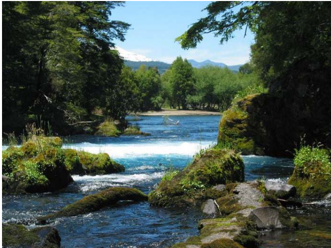
Vattendragen går inte heller av för hackor.