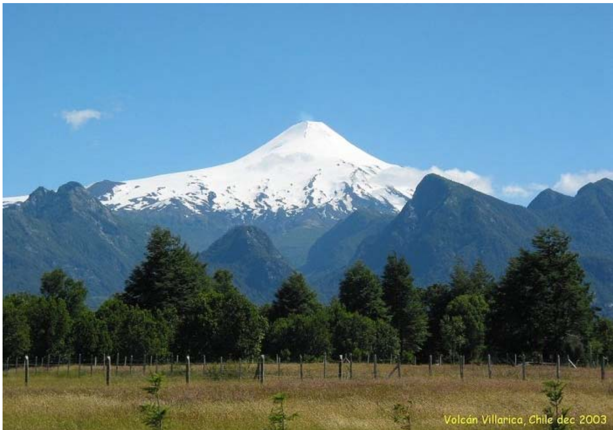
Volcán Villarica. Lagg märke till röken på toppen.

Det har varit många bilder på vulkanen i detta resebrev, men innan vi lämnar Chile måste vi allt ta en till. Volcán Villarica är tjustig.