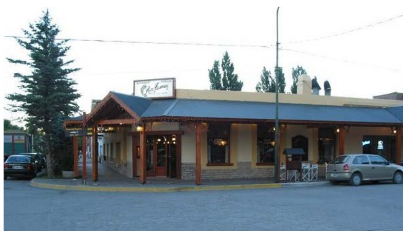
Bilden visar restaurangen Ruca Huney.

speciell Argentinsk röra av frukter och kryddor som tilltugg (kanongott), en sorts sallad av auberginer, 2 ensalada de fruta (fruktsallad) och kaffe. Allt detta kostade 148 SEK. Taxin till hotellet (c:a 1,5 km) kostade 2,94 Arg pesos = 8,10 SEK!! Vi gav chauffören 5 Arg pesos = 13,50 SEK och gissa om han blev glad. Detta var vid 23-tiden.