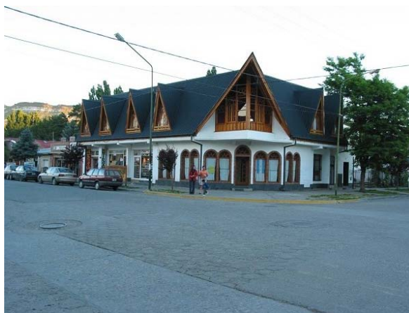
Några typiska byggnader i centrum av Junín. En mycket modern, ren och snygg småstad.