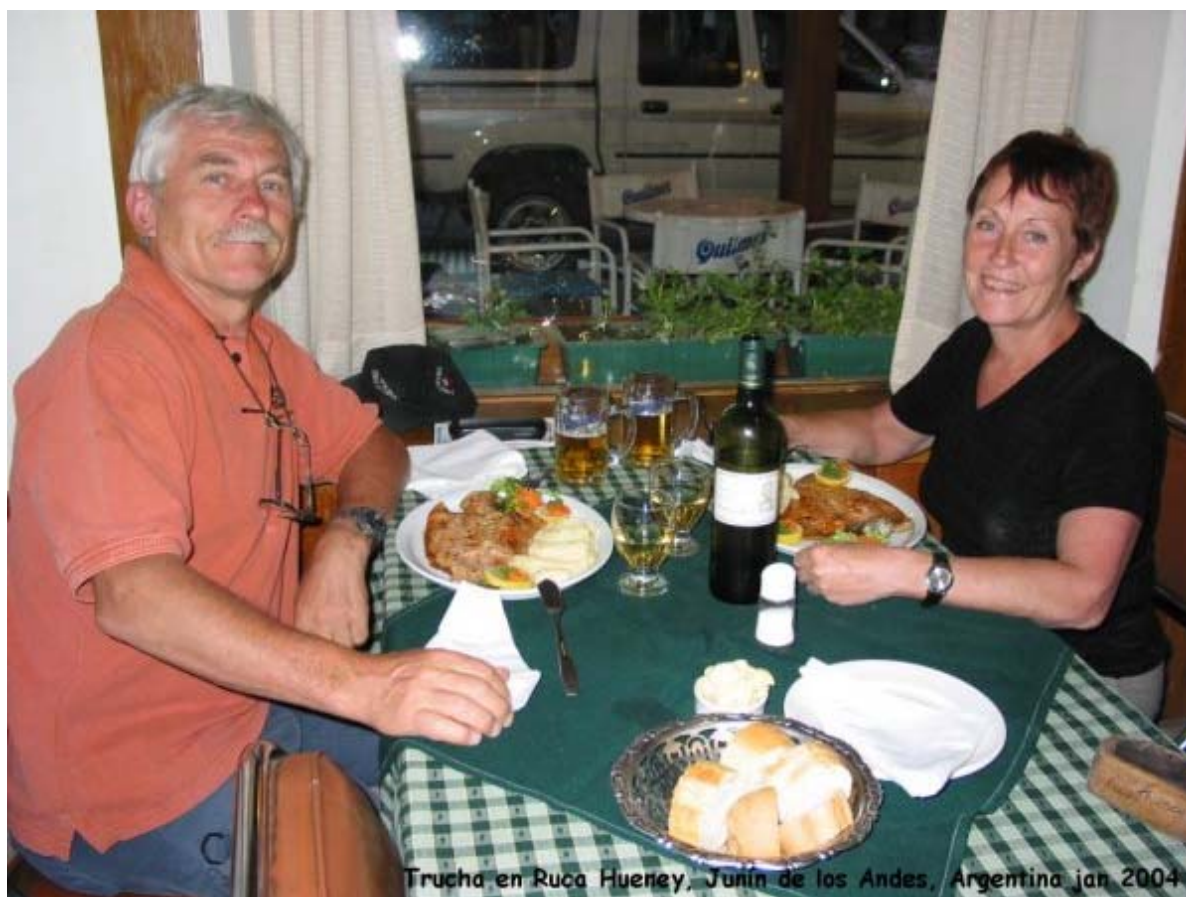
Trucha en Ruca Huene, Junin de los Andes, Argentina jan 2004

Eftersom vi var i "trucha" (öring) distriktet var det ju självklart att vår sista middag i Argentina skulle vara just trucha. Denna fantastiska öringmiddag avnjöts på en restaurang som heter Ruca Huney. Det blir väl tjtatigt med alla dessa priser, men det går inte att låta bli att berätta om vad denna middag innehöll och priset. 2 stora truchafiléer (som var benfria), pressad potatis, 2 stora öl, 1 flaska vitt vin (kostade 27 SEK och var kanongott), bröd med en