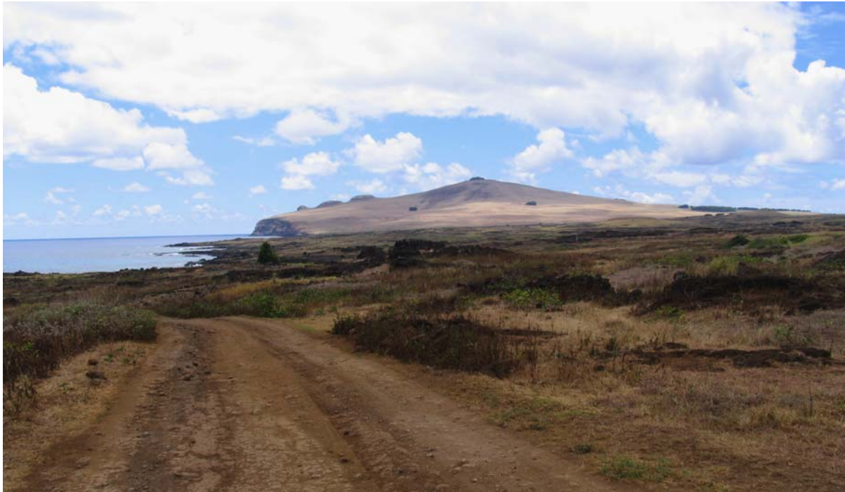
Grusvägen längs norra kusten. Bilden tagen österut mot Poike.