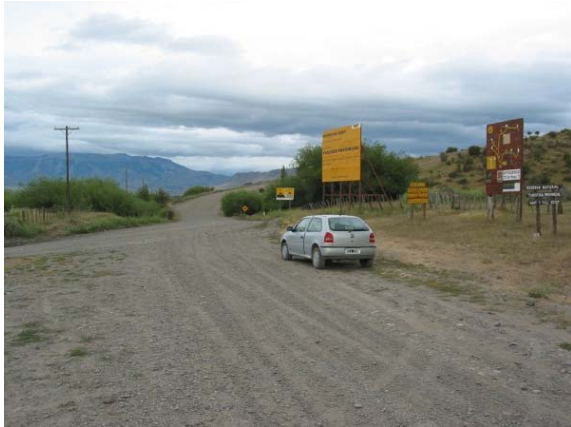
Vägen rakt fram går österut.

Här befinner vi oss ett par mil söder om Trevelin och här vände vi. Vid denna punkt befinner vi oss mycket långt söderut, söder om Australiens sydspets. Ändå är det över 220 mil bilväg ner till Argentinas sydligaste stad, Ushuaia som ligger på Eldslandet, Tierra del Fuego.