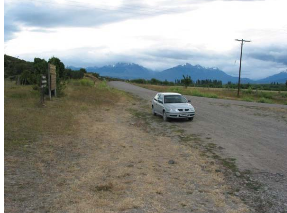
Åt andra hållet (västerut) går vägen till Chile. Bergen som syns bakom bilen ligger i gränsen mellan Argentina och Chile.