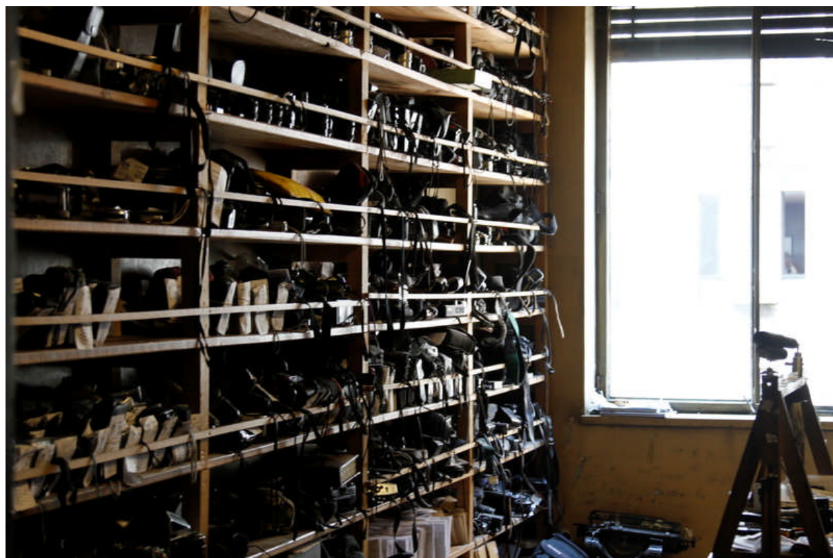
En bild in i kamerareparatörens hyllor.

Under tiden kamerareparatören jobbade med mina kameror gick vi och kollade vad nya kameror kostade. Han hade rekommenderat en stor butik mitt på en av gågatorna i centrum nära Plaza de Armas. Där fanns mycket att välja på. Den värsta Canonkameran vi hittade var EOS 7D (en likadan som jag hade lämnat till honom att laga) och priset var mer än det dubbla priset i Sverige! Vi kollade prisläget på ett par andra mindre kameror också och det blev samma resultat. Det blev alltså ganska snart klart för mig att om han inte kunde fixa kamerorna så att de gick att fota med, skulle jag i alla fall inte köpa en ny här i Santiago, p.g.a. priset.