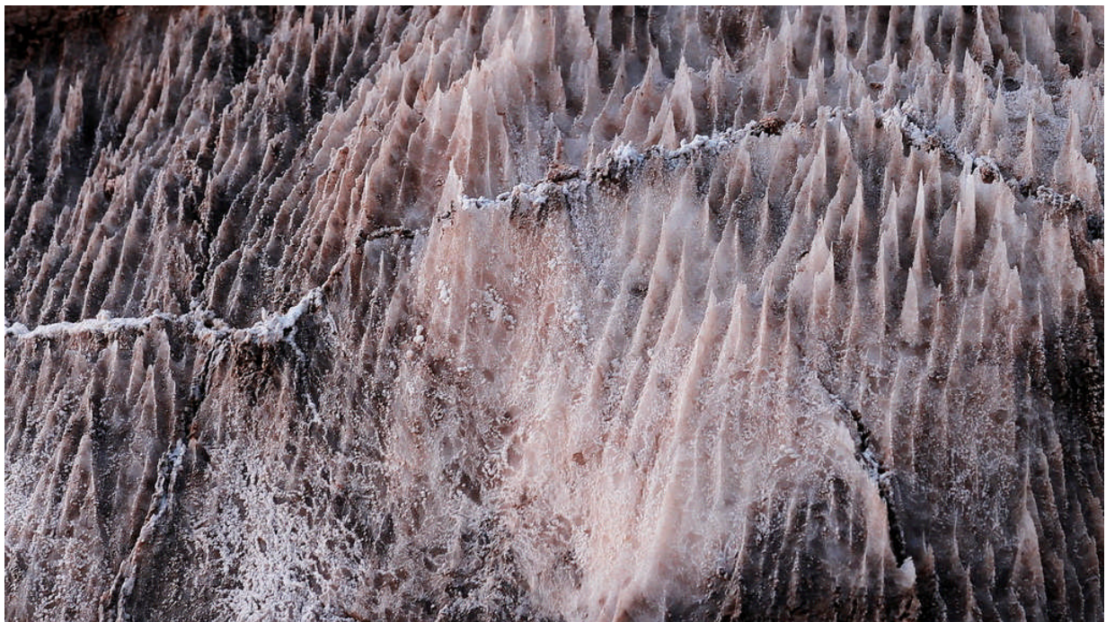
När vi går nära saltet som lagrats på klippor och berg ser vi att det bildats sylvassa spetsar och de är faktiskt vassa som nålar.