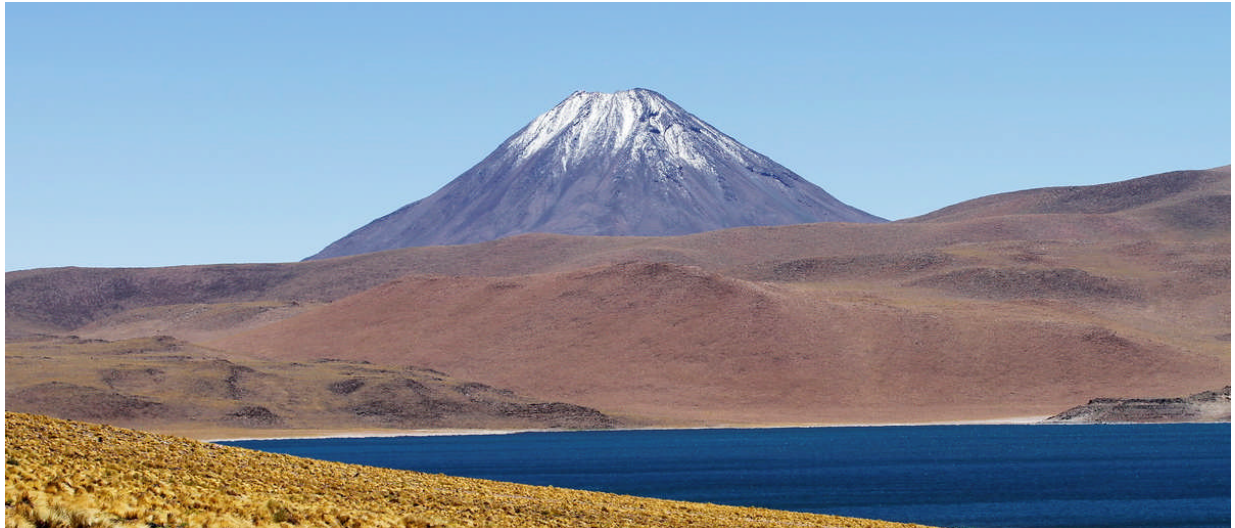
Laguna Miscanti med vulkanen Cerro Chiliques i bakgrunden.

Vi gjorde en dagsutflykt till en mycket högt belägen sjö som heter Laguna Miscanti. Den ligger på drygt 4.000 m.ö.h. och har inget utlopp. Området är numera en nationalpark och här fick vi inte röra oss fritt hur vi ville. Vi fick gå och åka längs den bilväg som leder hit och på den gångstig som syns längst till vänster på bilden. Den går från bilvägen ner till sjön. Vulkanen rakt fram är Cerro Miscanti med höjd av drygt 5.600 m.ö.h. I bakgrunden till vänster en annan vulkan, Cerro Chiliques, 5778 m.ö.h. Vi tog god tid på oss här på detta fantastiska ställe och vi stannade tills vi var nöjda. Den vita strandremsan är täckt av salt. Luften var härligt sval och det var absolut vindstilla. Här kan man tala om "hög" luft.