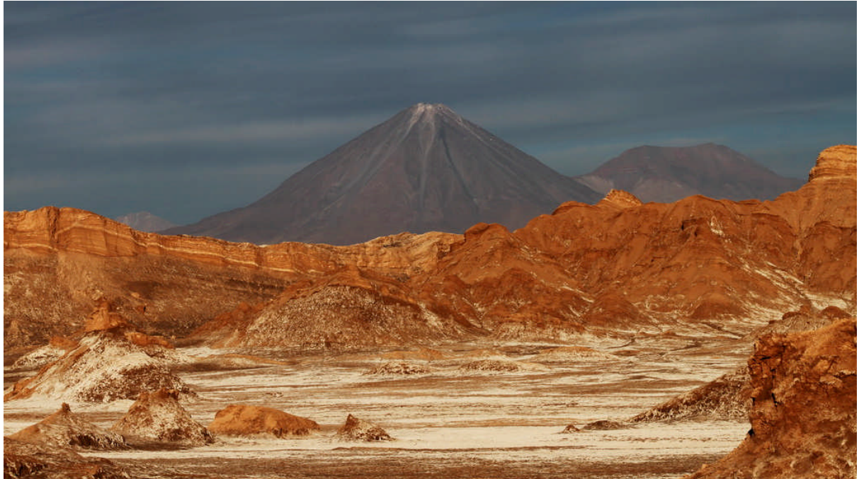
Valle de la Luna med den magnifika vulkanen Licancábur i bakgrunden. Den har en höjd av 5.920 m över havet och ligger på gränsen till Bolivia. Det vita i dalgången närmast i bilden är salt.

Vi började med att åka till Valle de la Luna, Måndalen, som ligger ca 10 km utanför staden. Dit kommer varje kväll en massa folk för att uppleva solnedgången i öknen, men vi valde denna första dag att åka dit i dagsljus. Valle de la Luna är otroligt torr och överallt runt omkring oss ligger det vitt salt. Denna kväll verkade inte bra för solnedgång så vi åkte omkring och fotade innan mörkret kom.